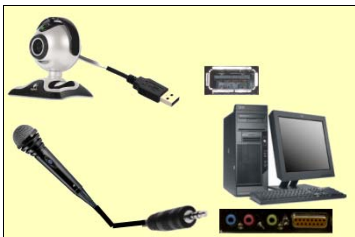
Conexiones Cámara-USB y Micrófono-Tarjeta Audio